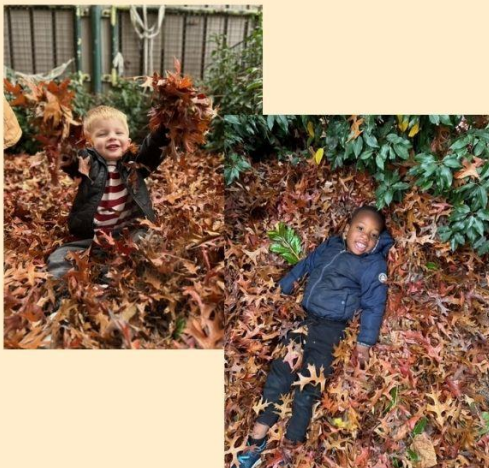
Idris en Seff